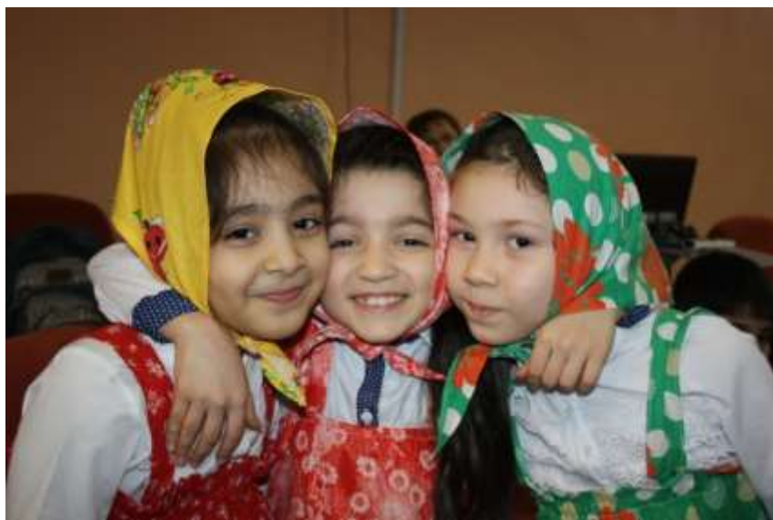
Тема «Русский народный фольклор»