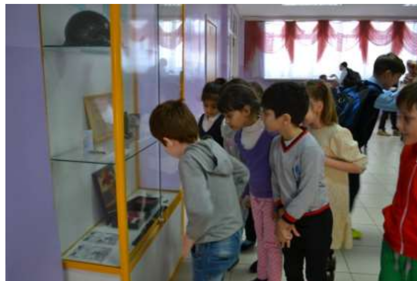
Тема «Российская Федерация: флаг, герб, гимн»