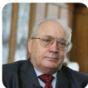
САДОВНИЧИЙ ВИКТОР АНТОНОВИЧ

президент Российского союза ректоров, ректор МГУ